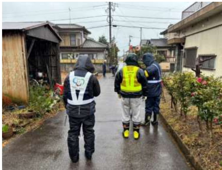
漏水調査（現地踏査）