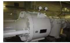
帯広の森減圧弁室 減圧弁等設備

西17条南3丁目 L=583m 稲田町西1線 L=980m 西17条南1丁目 L=412m 等