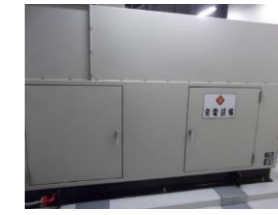
帯広川下水終末処理場 自家発電設備