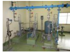
中島配水場配水ポンプ

簡水 中島配水場設備等更新 帯広の森減圧弁室設備等更新 岩内浄水場設備等更新の実施設計