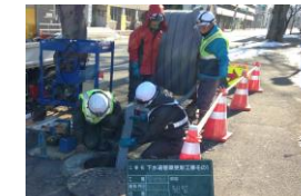
下水道管渠の長寿命化