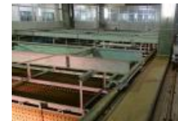
稲田浄水場 沈殿池設備 (傾斜板沈降装置)