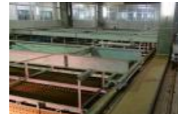
稲田浄水場 沈殿池設備 (傾斜板沈降装置)