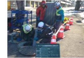
下水道管渠の長寿命化