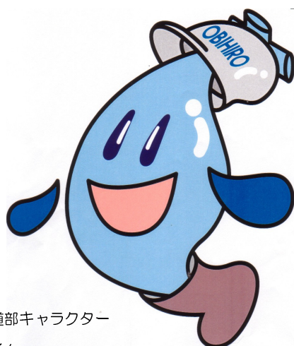
上下水道部キャラクター ミナモくん